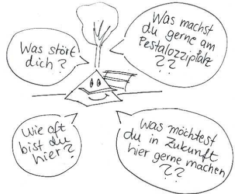
Beliebte Aktivitäten am Pestalozziplatz